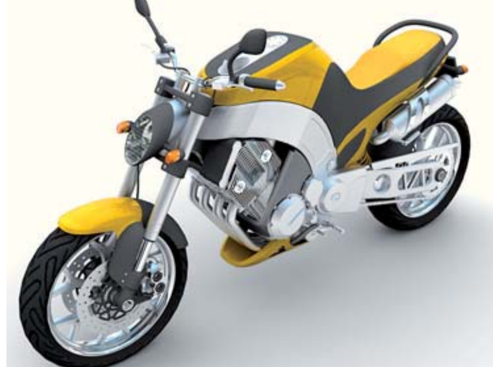
No nos ha especificado las características técnicas de esta moto, pero pinta muy bien.

Por lo menos a nosotros nos gusta mucho. Le ha quedado una motocicleta muy limpia, no tan recargada como la de los primeros bocetos. Y nos recuerda, cuando menos, un par de modelos bien diferentes: el tren delantero, desde la mitad del tanque de combustible, es muy parecido al de la Harley-Davidson V-Rod; la parte trasera, en cambio,