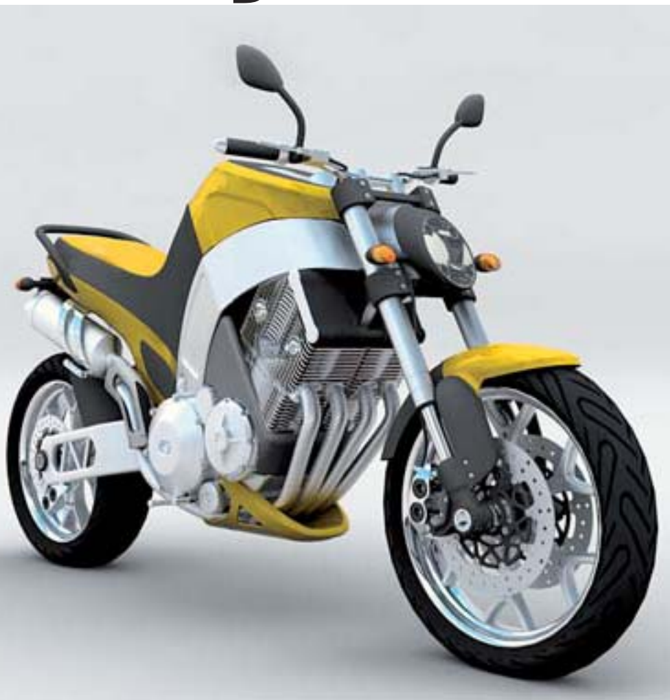
En esta vista tres cuartos superior de la Samal-Bike notamos ciertas similitudes con otros vehículos.

Dicen que sobre gustos no hay nada escrito. Algunos las prefieren con carácter y otros, que se dejen dominar con facilidad. También hay quienes se inclinan por las aventureras, viajeras, y quienes prefieren aquellas a las que sólo les guste salir un ratito el domingo por la mañana, y sólo si hace buen día. Dzimitry lo tiene claro: él se queda, sobre todo, con las que van escasas de ropa.